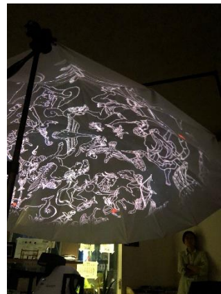
2mドームの設置例と投影の様子 (「青星」館内にて撮影)