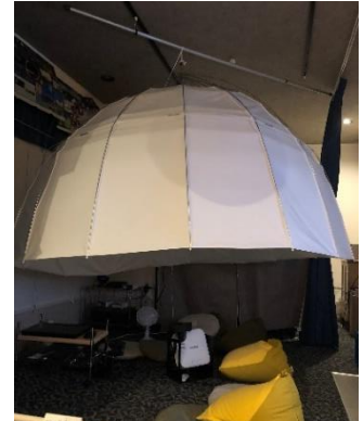
2.6mドームの設置例 (「青星」館内にて撮影)

当館のシステムでは、真っ暗になるお部屋は必要ありませんが、暗幕等で、ある程度暗くすることができる部屋の方が、より一層星を楽しめます。また逆に、真っ暗にする必要がないため、暗がりや怖がるような小さなお子様や、安全上の配慮から真っ暗にできない人でも、みんな一緒に楽しめます。